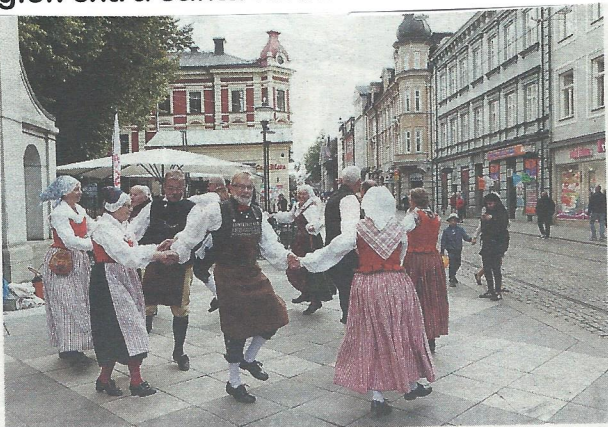
Genrer. Dans av alla slag framfördes runt om i Norrköping. Vid Stadstornet underhöll Hemgårdens folkdanslag.

Den 24 september var det som vanligt Kulturnatt igen och som vanligt var folkdanslaget på plats. Denna gång startade laget på Holmentorget vid Flygeln då Stadsbiblioteket inte hade plats i år. Många stannade upp och fick se en fin uppvisning. Sedan var det dags för Stadstornet. Där gjorde laget dacapo på programmet från Holmentorget. Även här stannade många upp och njöt av musiken och dansen. Till och med spårvagnarna gick extra sakta förbi.