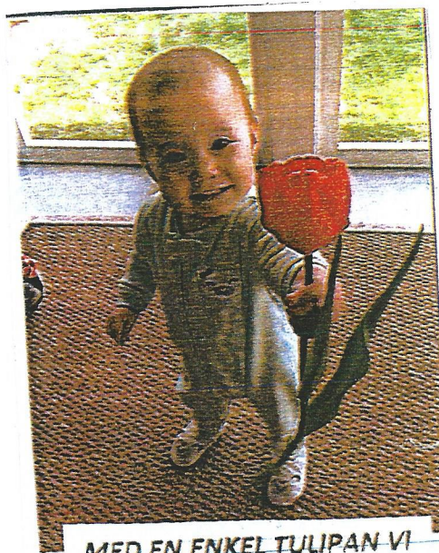
MED EN ENKEL TULIPAN VI GRATULERA