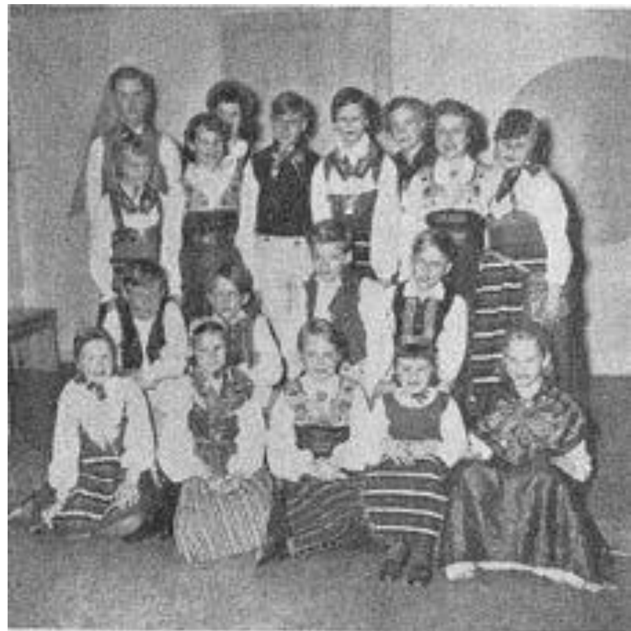
Så trevliga ungdomar har vi i Gubbängen.