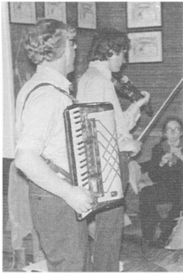
Sång på gång