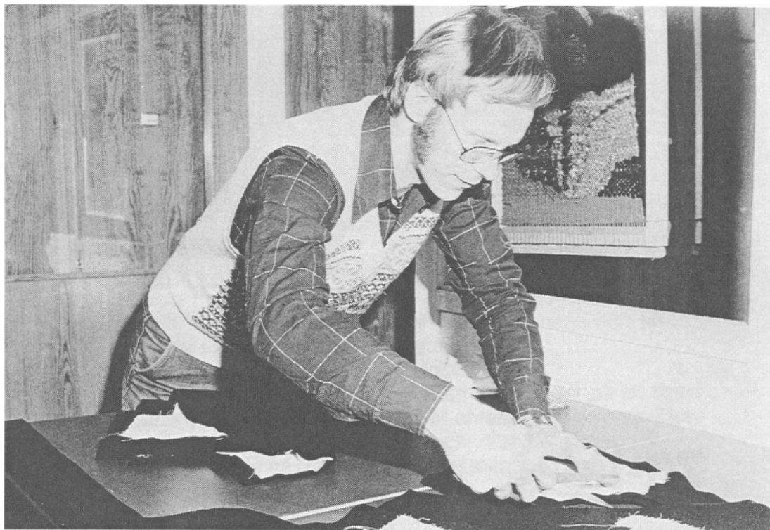
Hasse klipper till