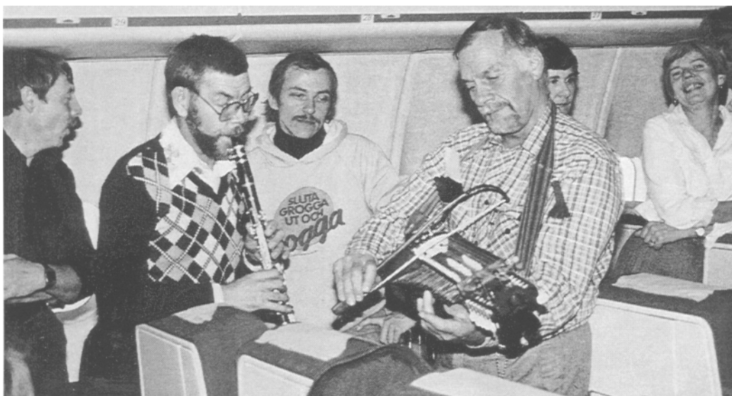
På väg till USA

USA, även om bergen var högre i Colorado. New York bjöd på ett strålande höstväder och Colorado bjöd på Denver, Colorado Springs och Loveland.