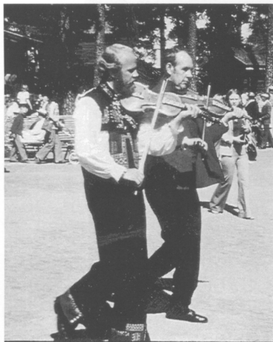
Två fina felor