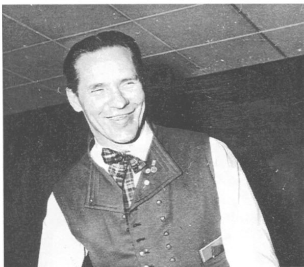
Viljans första ordförande