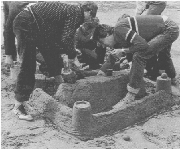
Landskamp i slottsbygge