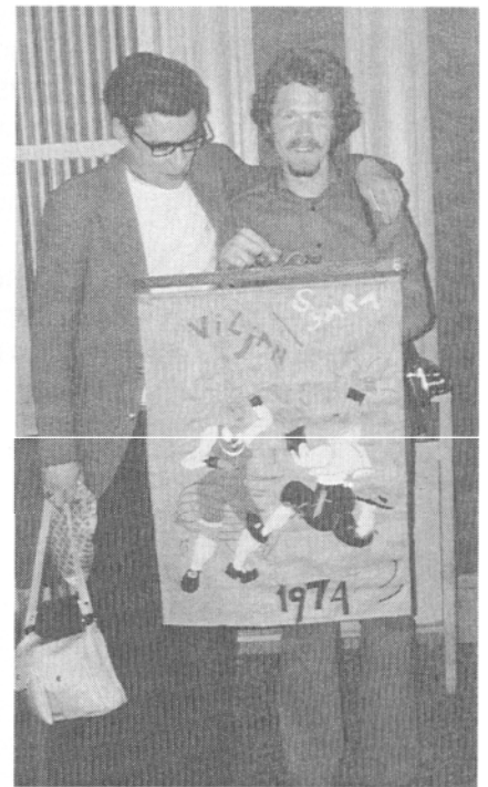
Avskedspresent överbämnas under högtidliga former