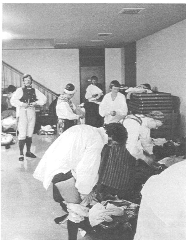
Turneliv USA 1981