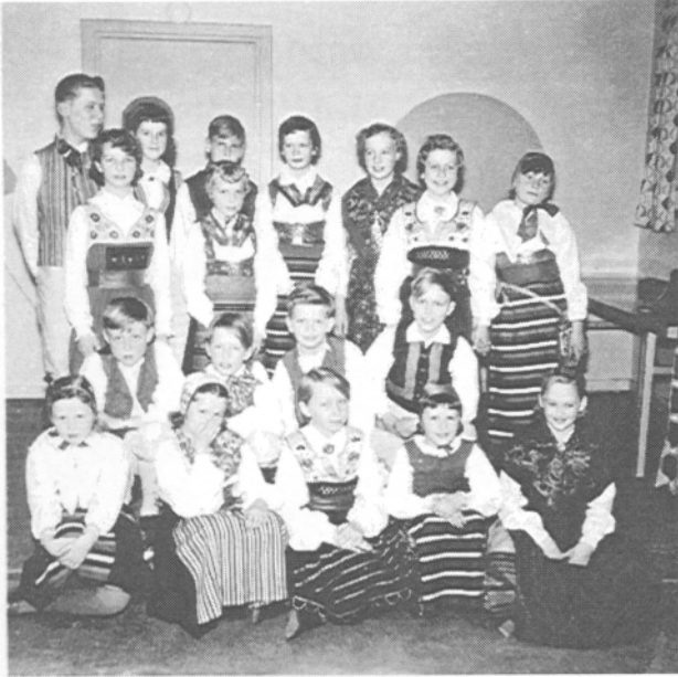
Grunden till juniorlaget