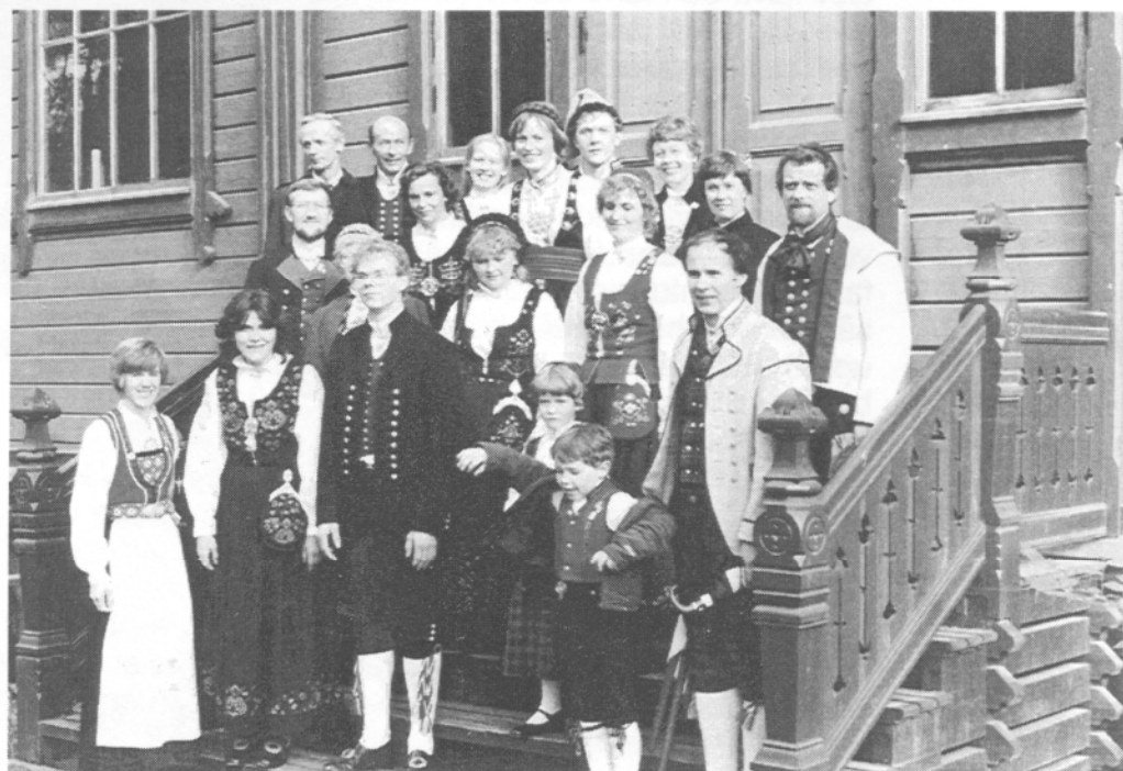
På Bygdöy 1983