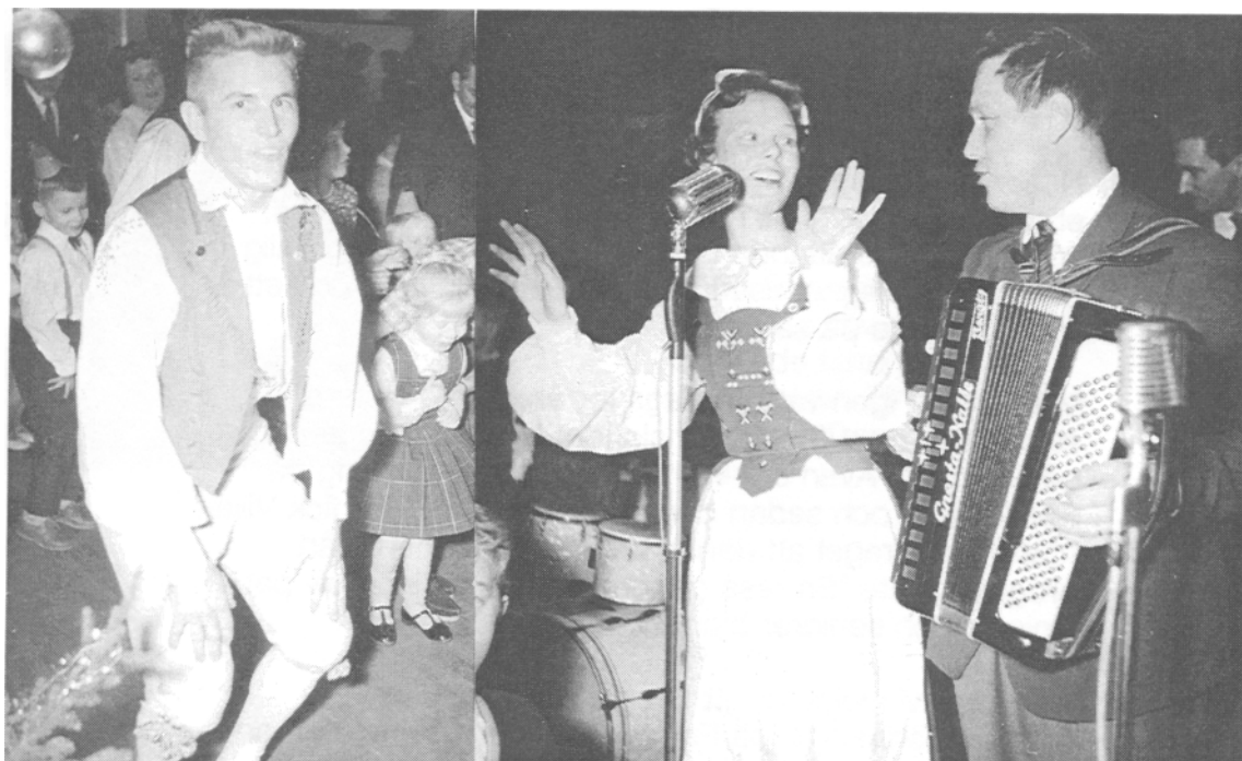
Lekledning januari 1960