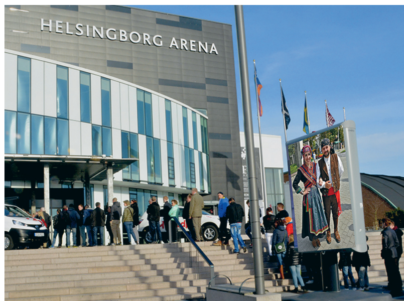
Helsingborg Arena rymmer inte ens alla de deltagande folkdansarna, så bara 200 biljett kommer att säljas (till högt pris) till invigning och avslutning. Bäst att ställa sig i kö redan! :-)