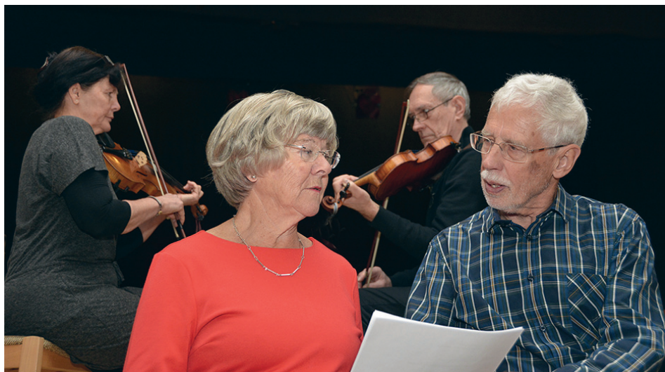
Samstämmiga.