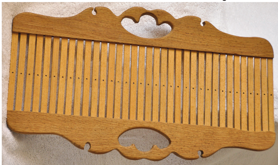
Ny bandgrind till bandvävning.

I Pilavisan nr 4/2014 fanns första delen av Petras föreläsning. Nu fortsätter vi med andra delen.