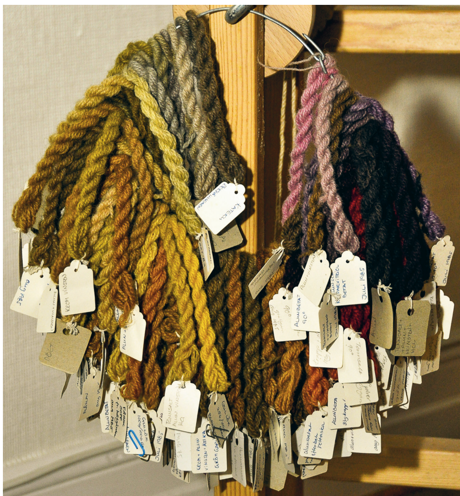
Växtfärgade ullgarner.

tidigt som under bronsålder. I Sverige finns ett tjugotal kända gravfynd med textilfragment. I ett numera nedbrunnet hus i kvarteret Humle i Malmö har rester av en varptyngd vävstol daterad till sent 1300-tal påträffats.