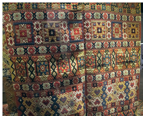
En färgglad vävnad i krabbasnår. Lagg märke till den perfekta mönsteranpassningen på mitten. En skicklig väverska kunde väva två längder så lika, att mönstret stämde perfekt, när de sen sydes ihop till en bredare vävnad.