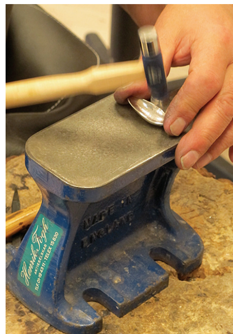
En stolpknapp till kragen blir till. Övre delen av knappen kupas med hammare.