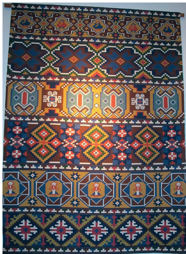
En väv i rölakan med typiskt skånska mönsterdetaljer: geometriska stjärnor, rosor och andra figurer.