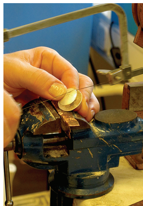
Utsågning i bottenplattan på stolpknappen, en skåra som underlättar knäppningen.