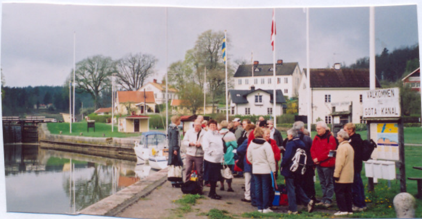
VAR ÄR BÅTEN?

Lördagmorgon var det tidig väckning. Klockan tio träffades alla i Mem, några hade till och cyklat dit, för att med båt ta sig ut på Slätbaken. Första stopp var vid Stegeborg där en guidad vandring ägde rum i slottsruinen. Sedan fortsatte båten till Capella Ecumenica där medhavd matsäck smakade jättebra. Vädret var bästa tänkbara med strålande solsken och vindstilla. Mätta och belåtna gjordes en rundvandring, dels i kapellet och på ön bland prunkande vårblommor och häckande ådor och måsar. Därefter gick båten tillbaka till Mem.