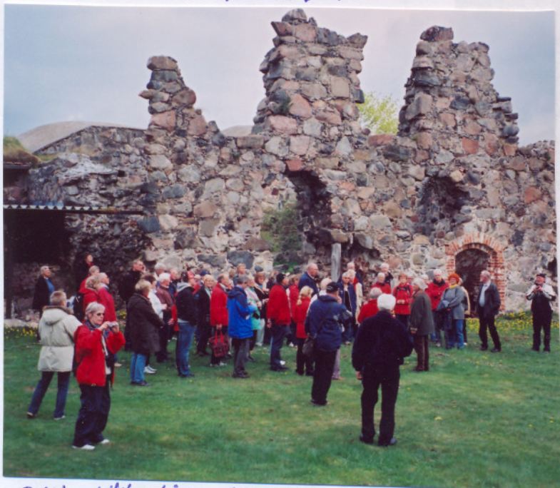
OCH HÄR ÄR STEGEBORGRUINEN.