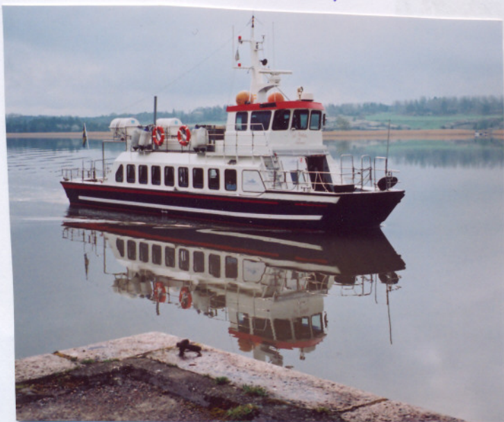
HÄR ÄR DEN.

Lördagmorgon var det tidig väckning. Klockan tio träffades alla i Mem, några hade till och cyklat dit, för att med båt ta sig ut på Slätbaken. Första stopp var vid Stegeborg där en guidad vandring ägde rum i slottsruinen. Sedan fortsatte båten till Capella Ecumenica där medhavd matsäck smakade jättebra. Vädret var bästa tänkbara med strålande solsken och vindstilla. Mätta och belåtna gjordes en rundvandring, dels i kapellet och på ön bland prunkande vårblommor och häckande ådor och måsar. Därefter gick båten tillbaka till Mem.